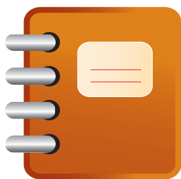
書籍型錄 常見裝釘方式